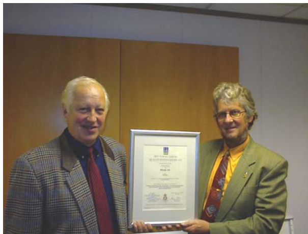
NS-EN ISO 9001 - Elrom Installasjon AS